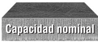
3/8 pulg. (9,5 mm) a 18 PPM

Nota: La capacidad de perforación máxima recomendada para las aplicaciones manuales es de 3/16 pulg. (4,8 mm). Capacidad máxima de corte de 5/8 pulg. (15,9 mm) a 6 PPM.